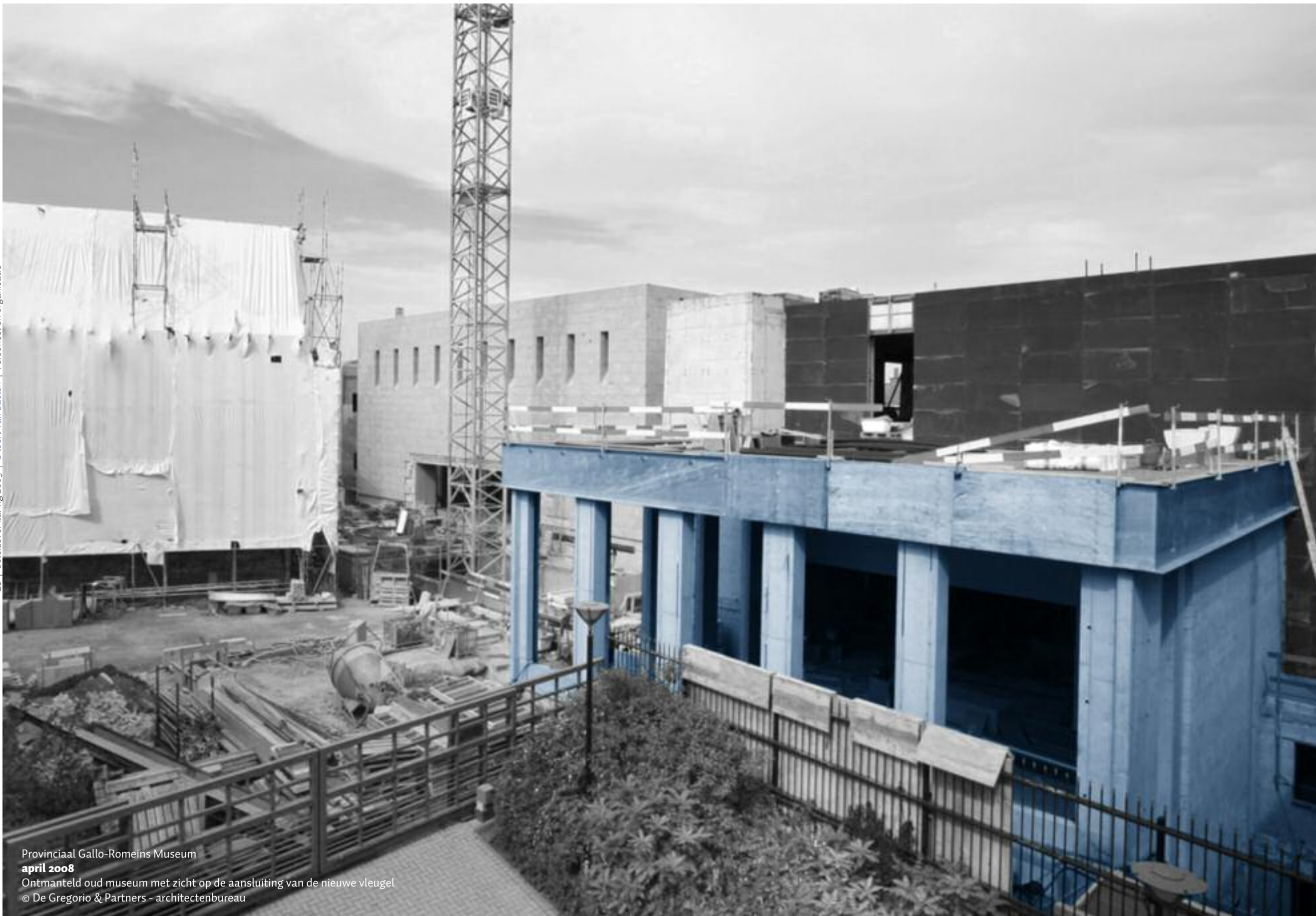
Provinciaal Gallo-Romeins Museum