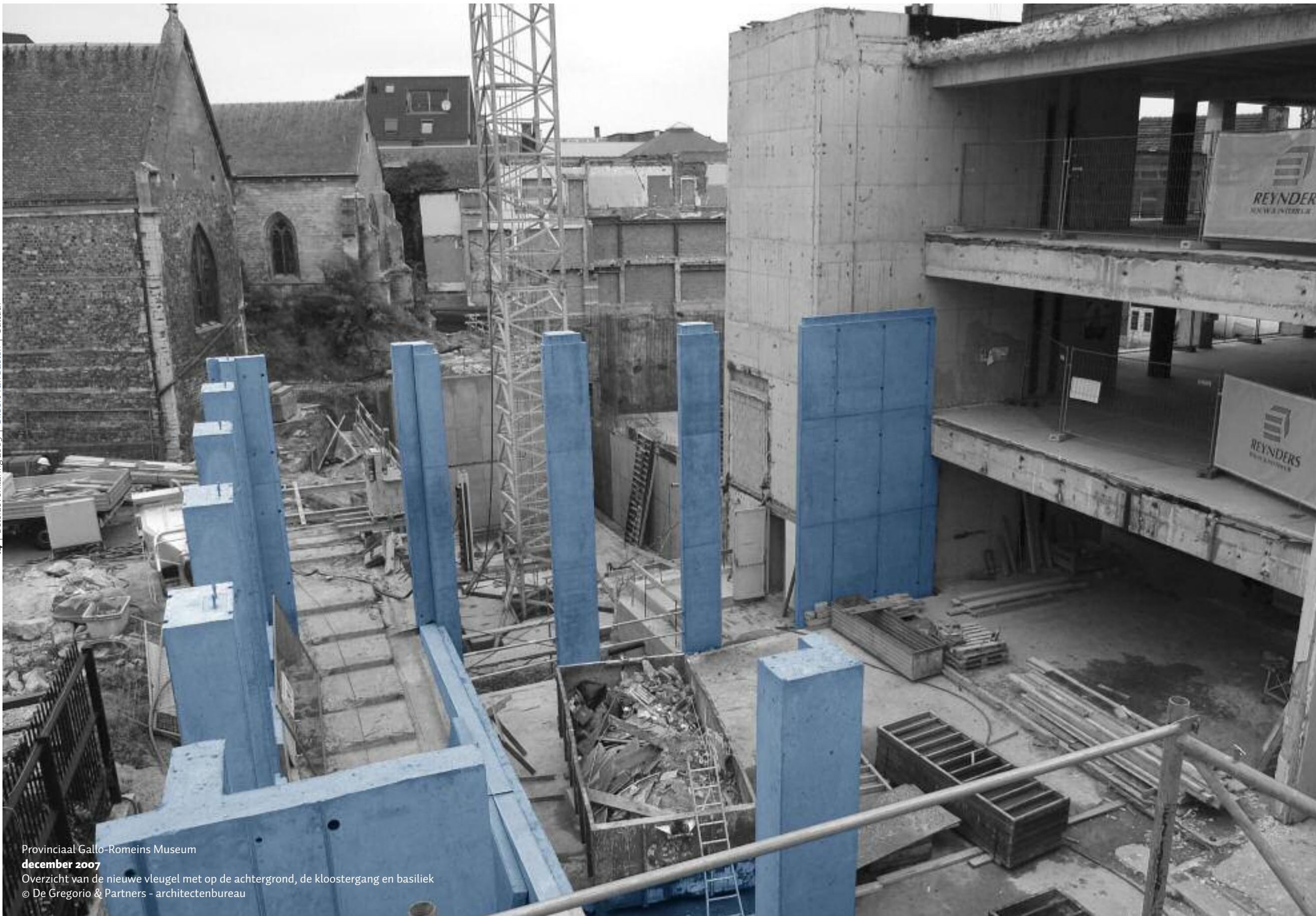
Provinciaal Gallo-Romeins Museum