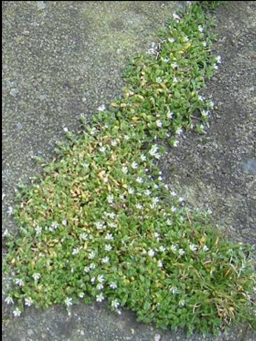
Cerastium semidecandrum – zandhoornbloem