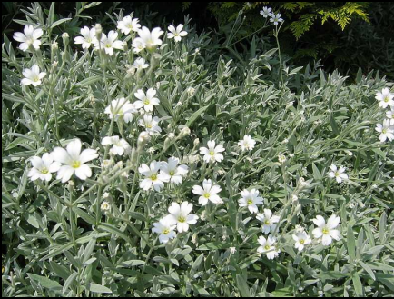
Cerastium tomentosum - vilthoornbloem