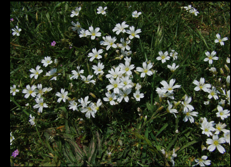
Cerastium arvense - akkerhoornbloem