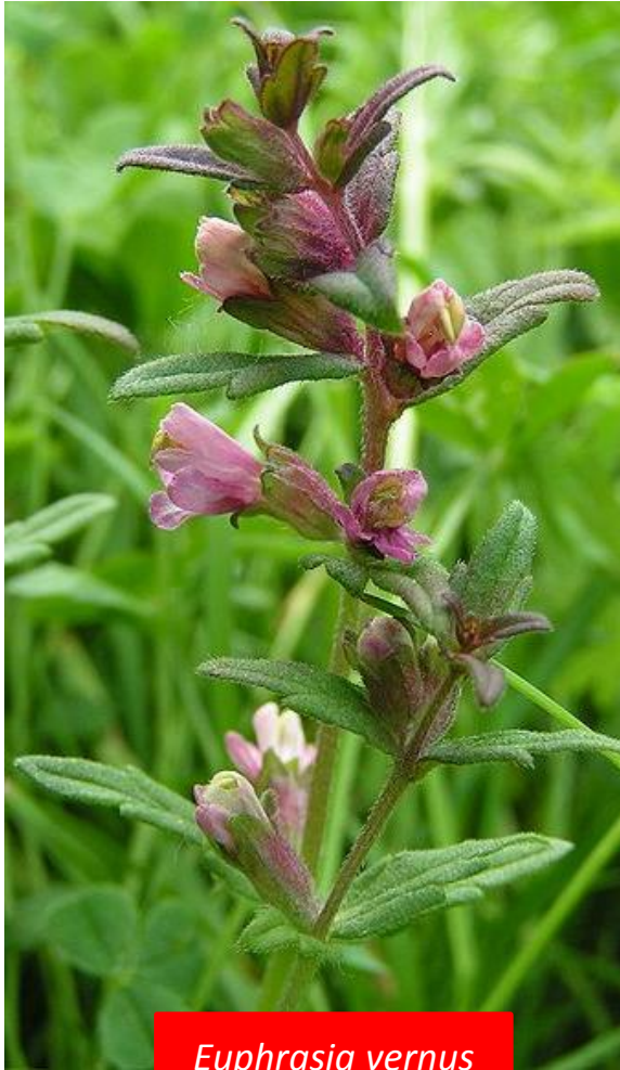
Euphrasia vernus ssp serotinus