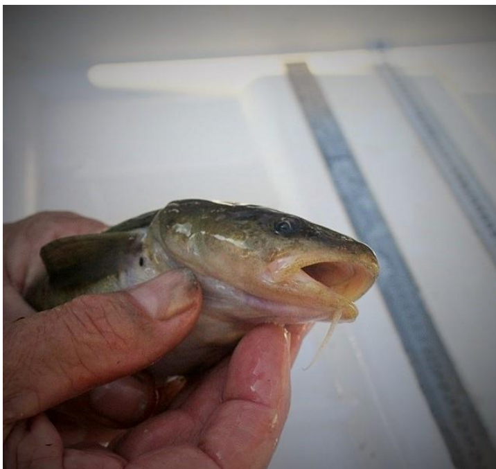
Kwabaal van 32 cm